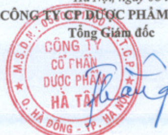
Lê Xuân Thắng

(Các thuyết minh từ trang 09 đến trang 40 là bộ phận hợp thành của Báo cáo tài chính riêng giữa niên độ này)